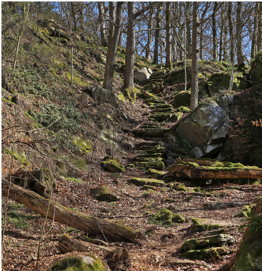
Den branta trappan upp på Riddaråsen strax söder om Tjolöholms kyrka. Trappan utgår från den stensatta "Fru Dicksons kyrkstig".

Kartbilden här intill visar det vittförgrenade nätet av stensatta stigar och trappor på Tjolöholmsfastigheten. Utbredningen har klarlagts av artikelförfattaren inom ramen för en nyligen genomförd kulturhistorisk utredning (Connelid 2021). Arbetet är tänkt att tjäna som underlag i samband med bildandet av ett naturreservat på fastigheten. Markeringarna på kartan återger sammanhängande avsnitt med stensatta stigar. Endast några få korta sträckor, t ex på kalt berg, saknar stensättning. Den sammanlagda längden stensatta stigar och trappor uppgår till cirka sju kilometer, vilket är mycket. Under inventeringen påträffades flera partier som inte tidigare var kända. Stigarna finns på eller i direkt anslutning till samtliga höjdparter ute på halvön och på Stuteribergen – den gamla utmarken – i nordost.