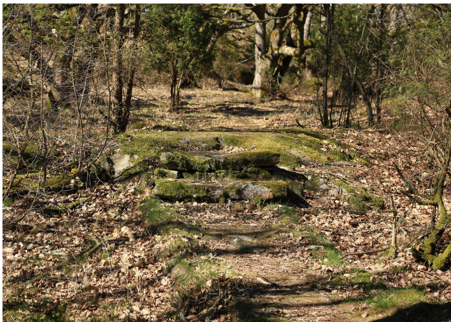
Trappsteg som leder in i ett av de typiska, naturliga "rummen" i Storeskog.