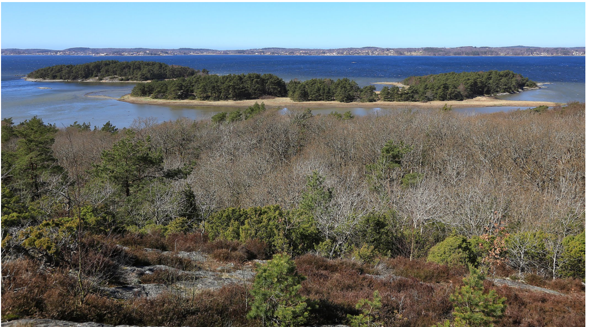
Utsikt över Kungsbackafjorden från Storeskogs högsta punkt. Närmast land syns Fäholmarna, i bakgrunden Onsala.