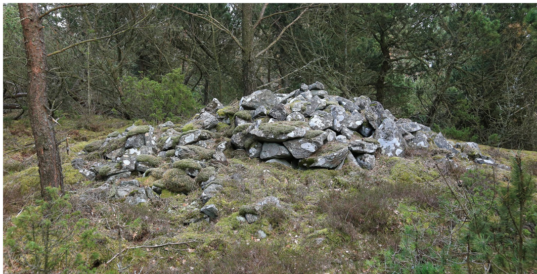
Gravröset nordost om Tjolöholms gård. En stensatt stig leder nästan ända fram till graven.