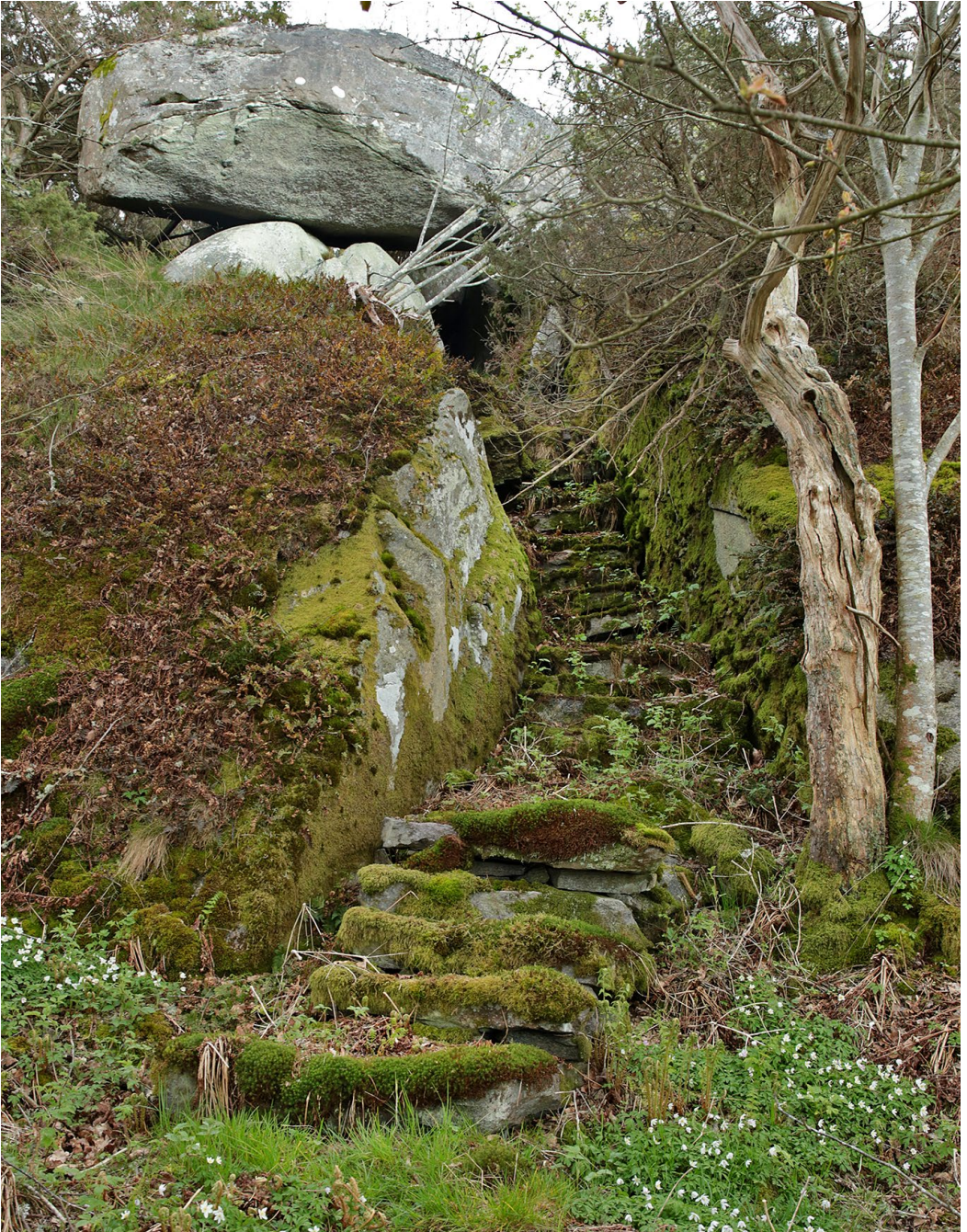
"Dösen" längst ut på Fasankullen. Notera den smala trappan som leder upp genom den trånga passagen genom berget.