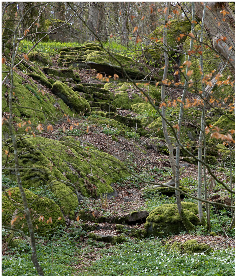
Flera av trapporna öster om slottet är placerade i sten- och blockrik terräng.

Ett par trappor leder fram till grottliknande formationer som bildats när flyttblock hamnat över sprickor i berget. Här avspeglas återigen fascinationen inför rumsbildningar och spektakulära naturbildningar i allmänhet. Den märkligaste miljön återfinns längst ut på Fasankullen på norra delen av halvön. Ett stickspår från huvudstråket längs stranden leder upp genom den steniga terrängen till en smal klyfta i berget. I den trånga passagen genom berget löper en välgjord trappa som upphör utanför ingången till ”grottan”. Bildningen påminner om en dös, en stenåldersgrav bestående av ett antal