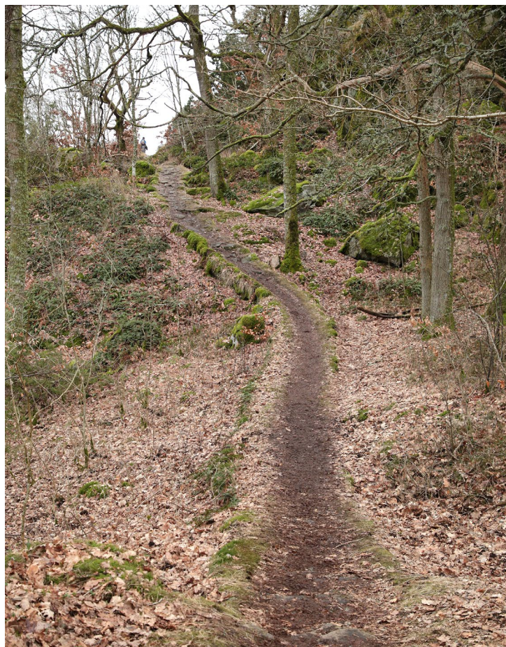
Stensatt stig i sydligaste delen av Storeskog. Idag löper här "Jägarns stig" och "Grevens runda".

ende. Flera är kraftigt övervuxna med mossor, vildkaprifol och ibland täta enbuskage, vilket visar att de inte har använts på mycket länge. Här och där tar dagens stigar "genvägen" rakt fram när de stensatta slingrar fram och tillbaka. På några platser löper sentida stigar tvärs över äldre, stensatta stråk, vilket tydligt signalerar att det är fråga om olika generationer. Trapporna är visserligen överlag stabila och välbyggda men vanligtvis i enkla, kallmurade konstruktioner.