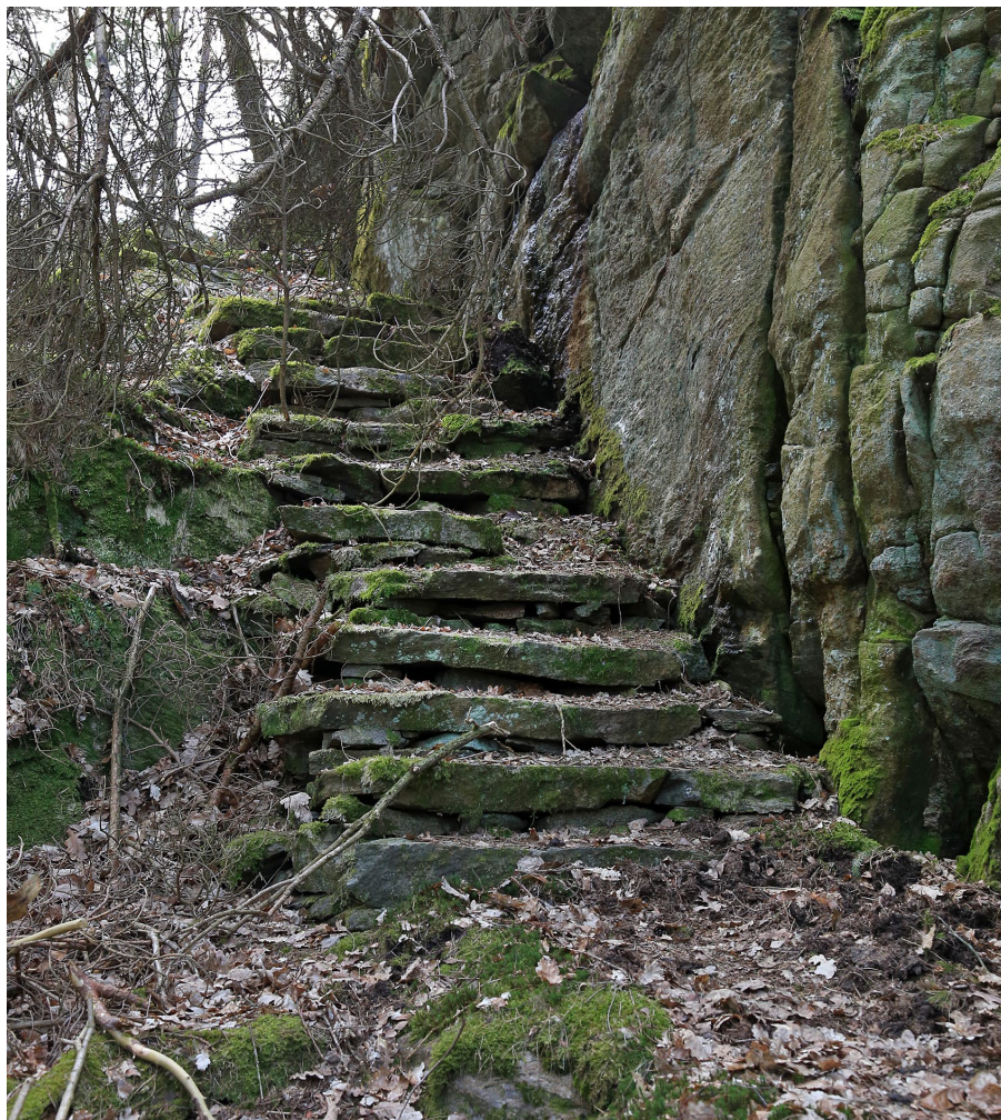
Flera av trapporna följer de branta bergväggarna, som här i Stuteribergen.

Trapporna förekommer frekvent längs de stensatta stråken men även utanför dessa. Det rör sig här om allt från små konstruktioner innehållande enstaka trappsteg till långa, sammanhängande partier som ibland löper i brant terräng. Det mest imponerande exemplet på det sistnämnda finner vi i den avslutande, skarpt sluttande backen ned mot Kungsbackafjorden längs fastighetsgränsen i nordost. I sydligaste delen av Storeskog finns ett par spektakulära, närmast ”vådliga”, trappor intill brant berg på väg upp mot utsiktsplatsen. Flertalet stigar är i förvånansvärt gott skick, även de som ingår i dagens vandringsstråk. Som tidigare nämnts är de nästan undantagslöst kallmurade.