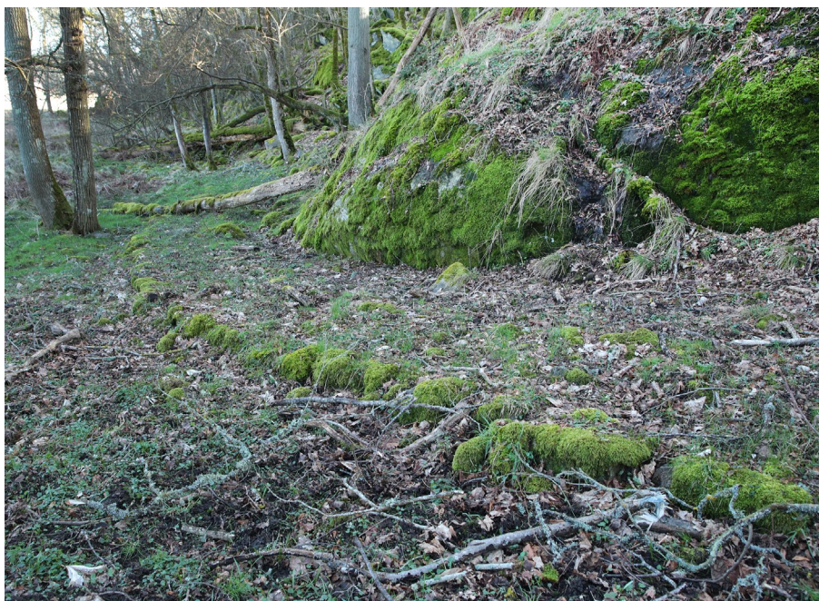
Stensatt stig norr om Fasankullen.

I Storeskogsområdet löper stigarna nästan uteslutande uppe på själva höjdområdet. Som framgår av kartbilden finns där ett nästan sammanhängande stråk, innehållande åtskilliga trappor. Även på de högt belägna delarna av gamla utmarken i Stuteribergen finns närmare ett par kilometer stensatta stigar. Ett genomgående drag är att de ofta