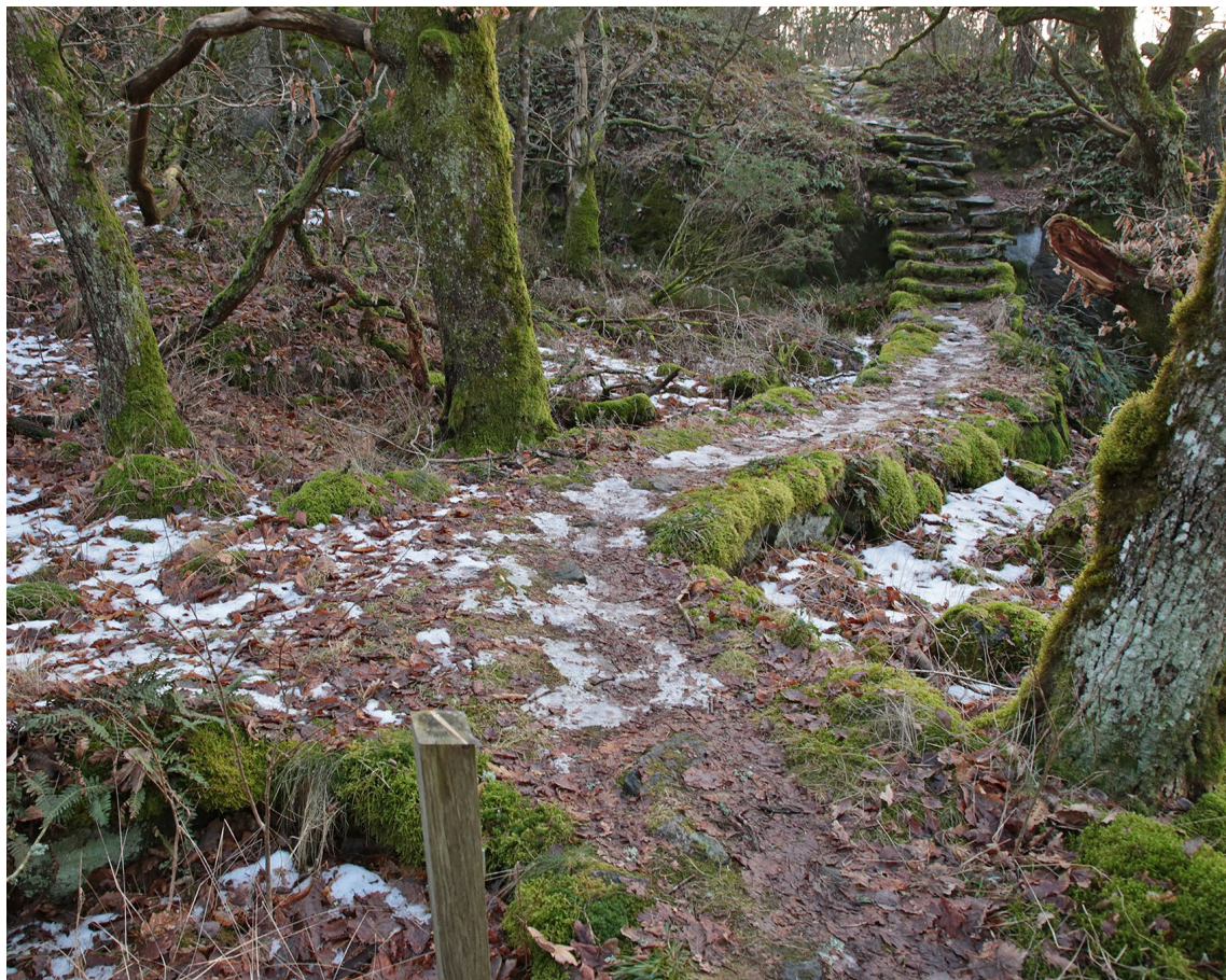
Vacker trappsektion med den anslutande stigen på ett högt fundament. Mellersta delen av Storeskog.

Flera av trapporna som letar sig upp på höjdpålsan strax öster om slottet är byggda bland löst liggande stenar och block. Ibland är det svårt att avgöra om det verkligen är fråga om trappor. Konstruktionerna smälter nästan samman med det naturliga underlaget som här skapar en dramatisk inramning. Kanske är platserna medvetet valda för att just förstärka känslan av orörd natur.