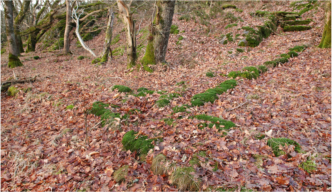
Korsning i mellersta delen av Storeskog, med ett "stickspår" till höger som leder upp till en utsiktsplats.