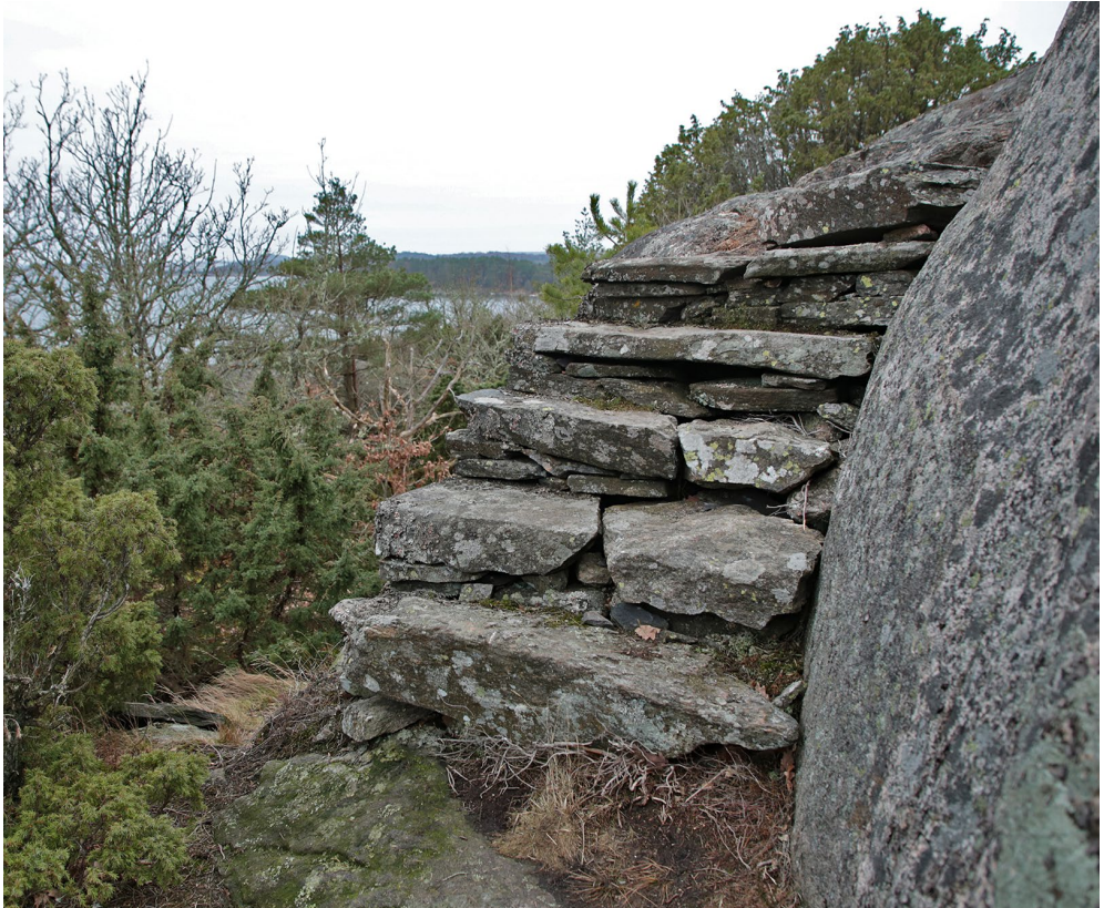
De stensatta stigarna och trapporna innehåller mängder av flata, delvis tillhuggna hällar som troligen körts fram till byggplatserna. Trapp vid södra utsikten i Storeskog.

De stensatta stigarna och trapporna är, som tidigare påpekats, överlag mycket välgjorda. Enhetligheten i utförandet och de stabila konstruktionerna vittnar om stor hantverksskicklighet. På många platser framgår att delar av stenmaterialet är tillhugget. Den stora mängden flata hällar i trappor och längs stigarnas ytterkanter verkar dock inte i någon större utsträckning ha hämtats i markerna närmast runt omkring. Tydliga tecken på stenbrytning, t ex kluvna block eller borrhål finns bara på några få platser utmed stråken. En del stenar och block kan naturligtvis ha hämtats på platser med stora mängder löst liggande material.