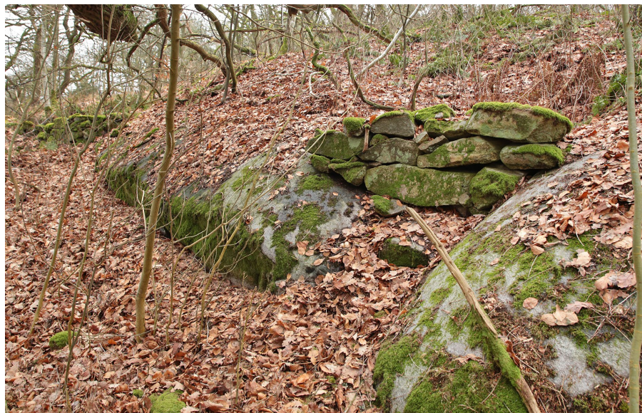
De högsta delarna av bergsformationerna ute på halvön var förr frånhågnade den övriga marken. Korta stenmurar användes för att "täta" hålen längs bergväggarna.

bevuxet än övriga höjdformationer och inte lika hårt betat. Förmodligen var inslaget av gamla, knotiga träd större här förr i tiden. Det är inte svårt att föreställa sig barns och vuxnas fascination inför detta landskap i slottets omedelbara närhet för hundra år sedan! Flera trappor leder upp till området. Förutom i söder saknas dock i hög grad stensatta stråk uppe på själva höjdplatån.