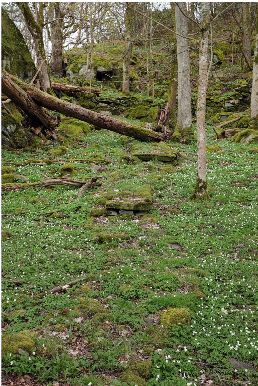
De stensatta stigarna slingrar sig fram och tillbaka.