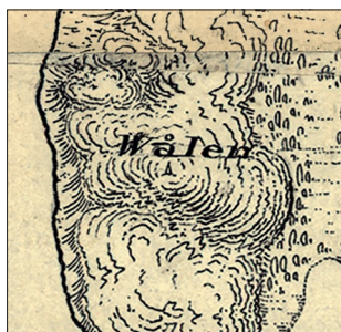
Detalj ur sjömningskartan över Kungsbackafjorden från år 1803. På högsta punkten i dagens Storeskog har kartritaren markerat ett sjömärke.

nessystemet Forsnök. I realiteten rör det sig om en enskiktad stenpackning som draperats över ett välvt bergskrön och som ursprungligen varit tänkt att likna ett röse. Stenpackningen är emellertid delvis uppriven och ombyggd till ett litet toppigt röse på högsta punkten. Förmodligen har man här rest ett sjömärke, kanske rent av "wålen" (wåle = sjömärke) som är markerad på ett sjökort från 1800-talets början. Utsikten från området är än idag fantastisk, framför allt mot söder. I början av 1900-talet erbjöd platsen ett 360 graders panorama och måste ha varit en av de mest attraktiva utsiktspunkterna längs hela stigsystemet.