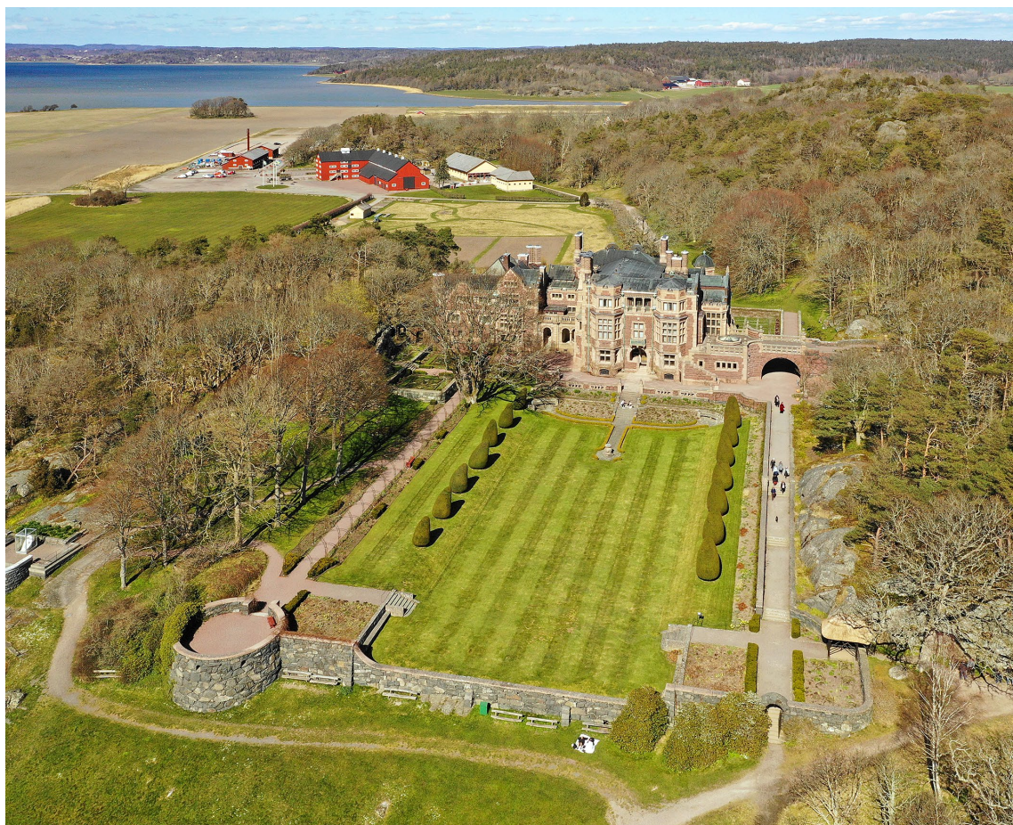
Tjolöholms slott med sin park och trädgård är en av landets främsta Arts & Crafts-anläggningar.

de flesta vandrarna är Storeskog, den västligaste och största bergsformationen ute på udden. I den varierade och delvis mycket dramatiska terrängen omedelbart öster om slottet löper också ett stort antal stigar. På slottets gamla utmark i nordost – idag kallat Stuteribergen – finns ännu flera.