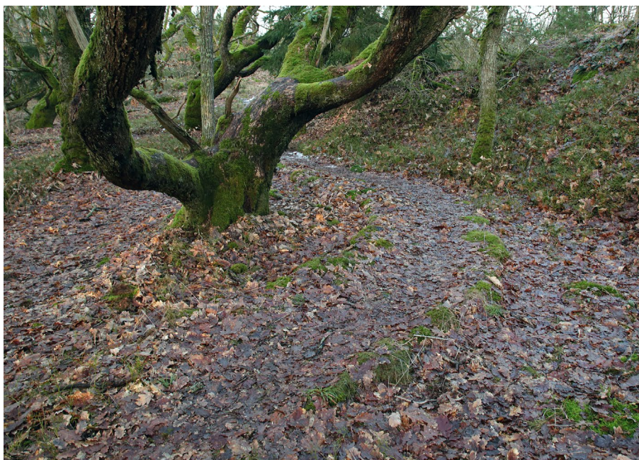
I Storeskog löper några av stigarna genom lågvuxen, starkt betespräglad ekskog.