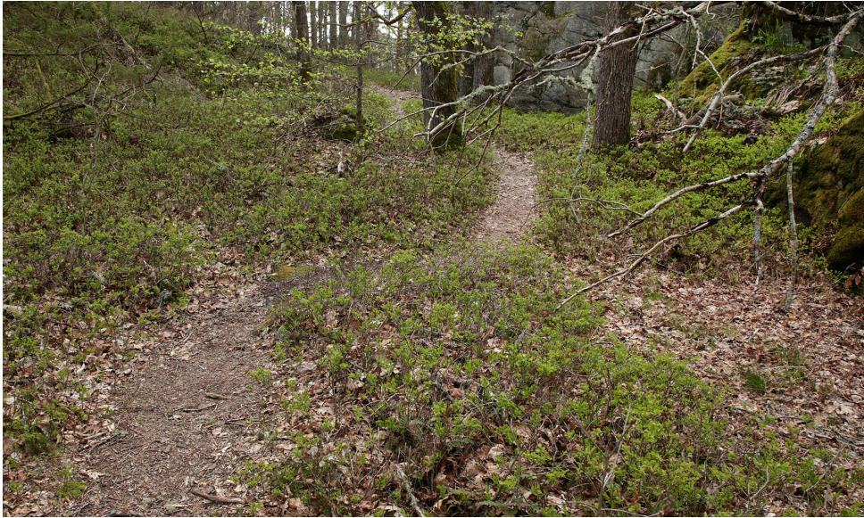
Här korsar dagens stig det gamla, stensatta stråket.